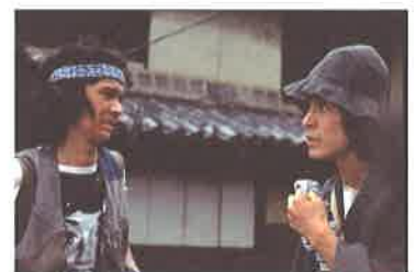
「悪霊島」(1981年/鹿賀丈史主演)