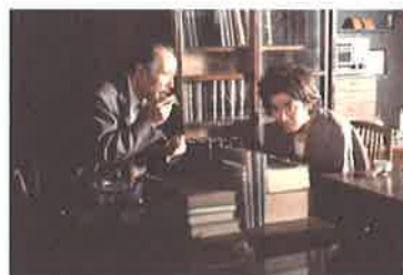
「犬神家の一族」(1976年/石坂浩二主演) ©KADOKAWA 1976