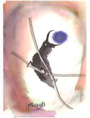
渡辺啓助カラス画 個人蔵