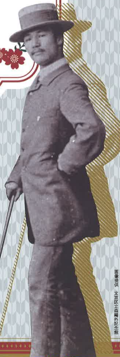
森鷗外 明治19年（1886）にて。