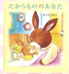
「たからもののあなた」 (2017年 岩崎書店)