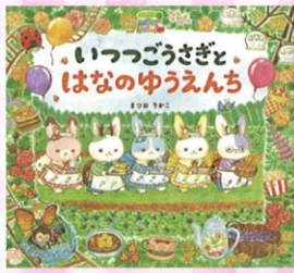
「いつつごうさぎとはなのゆうえんち」 (2025年 岩崎書店)

まつおりかこは、愛らしい動物たちが登場する絵本を数多く手がける絵本作家です。本展では、最新作『いつつごうさぎとはなのゆうえんち』の原画を初めて公開します！『たからもののあなた』、『ピカチュウと はじめてのともだち』など代表作の原画も展示。創作の背景とその魅力を紹介します。ぬくもりと笑顔があふれる、まつおりかこの世界をぜひ感じてみませんか。