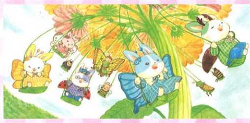
「いつつごうさぎとはなのゆうえんち」原画 (2025年 岩崎書店)